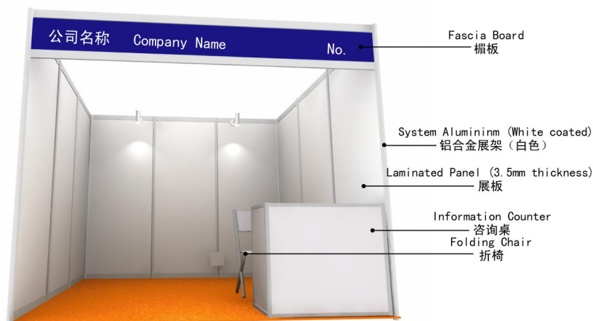
Standard Shell Scheme 铝合金标准展位